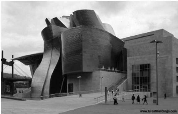
Εικόνα 2. Guggenheim Museum, Bilbao

Στην περίπτωση του προωθημένου σχήματος αυτό που χαρακτηρίζει την προσπάθεια είναι ότι η πρόσβαση σε υψηλή τεχνογνωσία μπορεί να δώσει μοναδικά αποτελέσματα. Το γνωστότερο τέτοιο παράδειγμα είναι το αρχιτεκτονικό γραφείο Frank O. Gehry and Associates (FOGA). Το γραφείο διευθύνεται πολύ καλά ως επιχείρηση και έχει επιτύχει μίαν οικονομική σταθερότητα. Ο ιδρυτής του, κάτοχος του βραβείου Pritzker, είναι ο ίδιος ψηφιακά αναλφάβητος. Ωστόσο το 1989 προσλαμβάνει τον James M. Glymph, που αργότερα γίνεται εταίρος του γραφείου, για να εντάξει τη ψηφιακή σχεδίαση στο FOGA. Επιλέγεται το πιο εξελιγμένο τρισδιάστατο πρόγραμμα (CATIA), το οποίο προέρχεται από την αεροδιαστημική βιομηχανία. Η κατασκευάστρια εταιρεία (Dassault) εκπαιδεύει προσωπικό στο χώρο του γραφείου. Με όλα αυτά η πρώτη δοκιμή γίνεται σε ένα πολύ