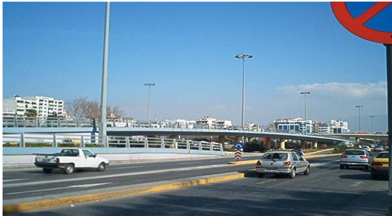
Φωτ. 5. Οι γέφυρες της Λ. Τροχιοδρόμων και Καραϊσκάκη στο βάθος στις 13/01/2002

Η κυκλοφοριακή κατάσταση στην περιοχή ήταν προβληματική, γιατί οι οδηγοί από τα παραλιακά προάστια (Παλαιό Φάληρο, Άλιμο, Γλυφάδα κλπ) με προορισμό την Λαμία αλλά και αντίστροφα, ήταν υποχρεωμένοι να διέρχονται μέσω της γέφυρας Καραϊσκάκη για να εισέλθουν στην οδό Πειραιώς και από εκεί στην Εθνική οδό.