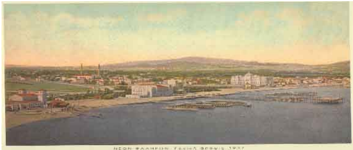
Φωτ. 2. Το Ν. Φάληρο, γενική άποψις 1907

Μέχρι το 1950 η περιοχή του Ν. Φαλήρου δεν είχε αλλοιωθεί σημαντικά. Υπήρχαν τα ξενοδοχεία τα οποία βέβαια είχαν παλιώσει, η περιοχή είχε αρχίσει να πυκνοκατοικείται, ο σταθμός του Η.Σ.Α.Π ήταν σε λειτουργία αλλά η παραλία δεν είχε ακόμη μπαζωθεί.