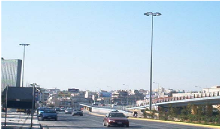
Φωτ. 4. Η Λ. Τροχιοδρόμων στο Ν. Φάληρο στις 13/01/2002