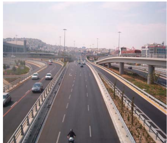
Φωτ. 8. Ο Α/Κ στις 22 Ιουλίου 2004 που παραδόθηκε σε κυκλοφορία.