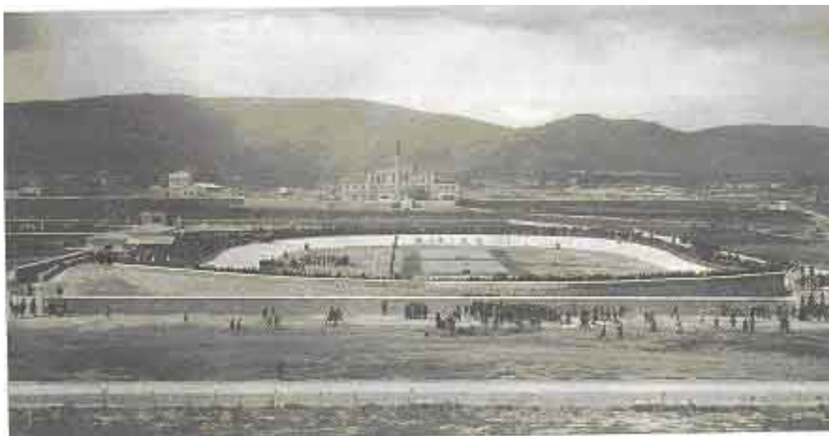
Φωτ. 1. Το Ποδηλατοδρόμιο στο Ν. Φάληρο. Γενική άποψη κατά τη διεξαγωγή της Ποδηλατοδρομίας. Μετά τους Ολυμπιακούς Αγώνες άρχισε να φιλοξενεί και αγώνες ποδοσφαίρου.

Η παραλιακή περιοχή του Ν. Φαλήρου στις αρχές του 20 ου αιώνα ήταν τόπος αναψυχής με μεγάλα νεοκλασσικά ξενοδοχεία όπως το "Ακταίον" που σήμερα έχουν κατεδαφισθεί, με εξοχικές κατοικίες που είχαν ταυτότητα και στην παραλία της υπήρχαν οργανωμένες εγκαταστάσεις για τα θαλάσσια μπάνια.