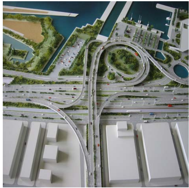
Φωτ. 7. Η Μακέτα του έργου, γενική άποψη και γενική άποψη του δακτυλίου.

Με την λειτουργία του Α/Κ συνδέθηκε απ' ευθείας ο Πειραιάς με την Εθνική Οδό (Λαμία) και αντίστροφα, οι περιοχές της παραλιακής ζώνης (Γλυφάδα κ.λ.π) με την Εθνική Οδό και αντίστροφα, οι περιοχές που γειτνιάζουν με τον κόμβο, το Ν. Φάληρο και το Μοσχάτο, με την Εθνική Οδό αλλά και με τον Πειραιά και τις περιοχές της παραλιακής ζώνης και το Σ.Ε.Φ και αντίστροφα ( Πειραιάς, Γλυφάδα, Ν. Φάληρο, Μοσχάτο )