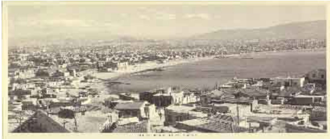
Φωτ. 3. Το Ν. Φάληρο, γενική άποψις 1950