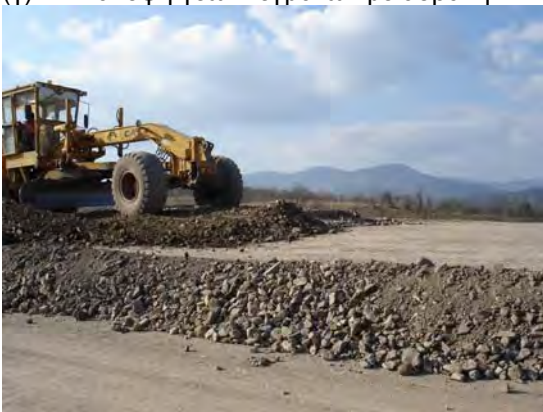
(ε) Ομοιόμορφη κατανομή αδρανούς