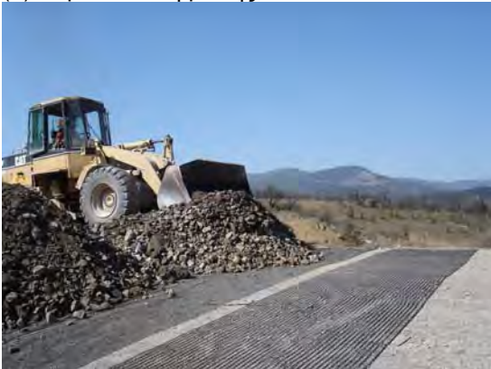
(γ) Επικάλυψη γεωπλεγμάτων με αδρανή