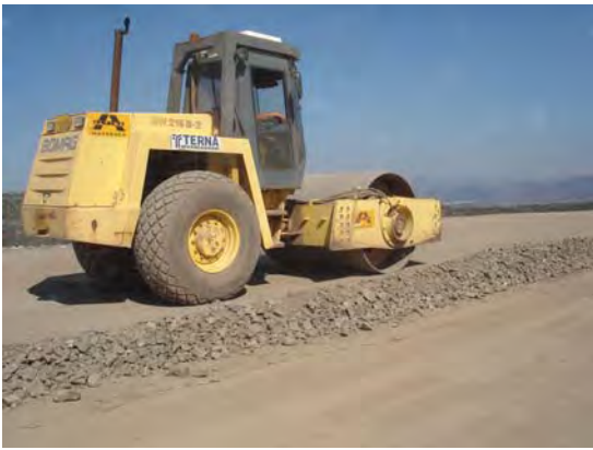
(α) Συμπύκνωση βάσης