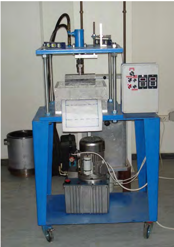
Σχήμα 5. Εργαστηριακός εξοπλισμός (ENV ISO 10722-1) Figure 5. Laboratory equipment (ENV ISO 10722-1)

με ύψος (βάθος) 75mm το κάθε ένα. Στο κάτω μέρος του θαλάμου τοποθετούνται δύο στρώσεις αδρανούς που συμπυκνώνονται με εφαρμογή πίεση 200kPa για 60s. Στην επιφάνεια αυτών των στρώσεων, τοποθετείται το δοκίμιο του γεωσυνθετικού και, ακολούθως, συμπληρώνεται με αδρανές σε χαλαρή κατάσταση το άνω μέρος του θαλάμου. Η φόρτιση γίνεται μέσω άκαμπτης πλάκας διαστάσεων κάτοψης 100mmx200mm. Εφαρμόζεται ανακυκλιζόμενο φορτίο, από 5kPa έως 900kPa, με συχνότητα 1Hz για 200 κύκλους φόρτισης.