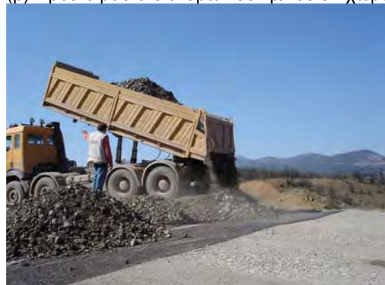
(δ) Απόθεση αδρανούς με φορτηγό