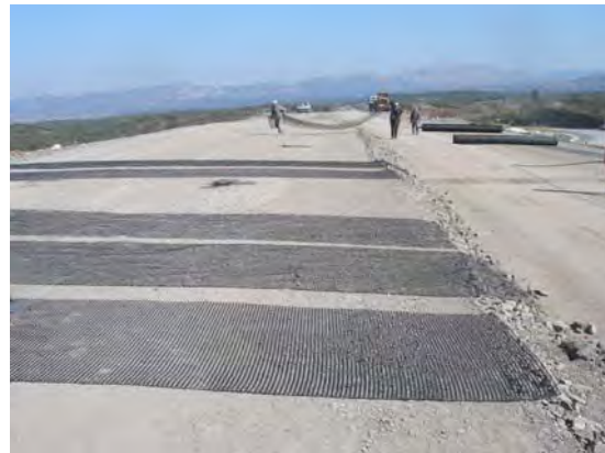
(β) Προετοιμασία διατομών δοκιμ/κού επιχώματος