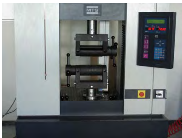
Σχήμα 4. Κυλινδρικές αρπάγες Figure 4. Roller grips

Τα δείγματα πεδίου μεταφέρθηκαν στο εργαστήριο όπου καθαρίστηκαν προσεκτικά με μαλακή βούρτσα για την απομάκρυνση κόκκων του αδρανούς από την επιφάνειά τους. Ο συντελεστής φθοράς κατά την τοποθέτηση, RF_{ID} , προσδιορίστηκε με βάση την απομένουσα αντοχή σε εφελκυσμό των γεωπλεγμάτων τόσο κατά τη διεύθυνση παραγωγής (MD) όσο και κατά την εγκάρσια διεύθυνση (CD). Η αντοχή σε εφελκυσμό τόσο των φθαρμένων δειγμάτων όσο και των δειγμάτων “αναφοράς” προσδιορίστηκε σύμφωνα με τις προβλέψεις του πρότυπου ASTM D6637-Method B. Οι δοκιμές εφελκυσμού εκτελέστηκαν με χρήση κυλινδρικών αρπαγών διαμέτρου 100mm και πλάτος 200mm που φαίνονται στο Σχήμα 4. Το απαιτούμενο μήκος δοκιμίου ήταν περίπου 1,25m. Χρησιμοποιήθηκε πλαίσιο εφελκυσμού -θλίψης 100kN χωρίς καταγραφή παραμορφώσεων αφού αυτή η παράμετρος δεν υπεισέρχεται στην εκτίμηση της φθοράς κατά την τοποθέτηση. Ο ρυθμός σχετικής μετακίνησης