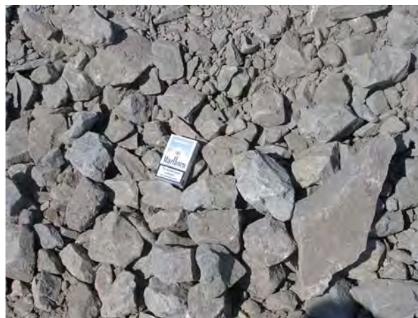
Σχήμα 1. Αδρανές πεδίου Figure 1. Field aggregate

Το αδρανές που χρησιμοποιήθηκε για την κατασκευή του δοκιμαστικού επιχώματος λήφθηκε από υπάρχοντα αποθέματα που παράγονταν επί-τόπου, με χρήση θραυστήρα, για να καλύψουν τις ανάγκες κατασκευής των οπλισμένων επιχωμάτων του έργου και θεωρείται αντιπροσωπευτικό των συνθηκών πεδίου ως προς την κοκκομετρία και το σχήμα των κόκκων του αδρανούς. Όπως φαίνεται στα Σχήματα 1 και 2, το αδρανές έχει γωνιώ-