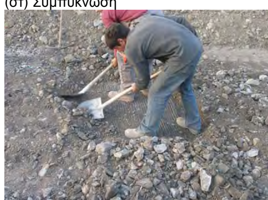
(η) Χειρωνακτική απομάκρυνση αδρανούς