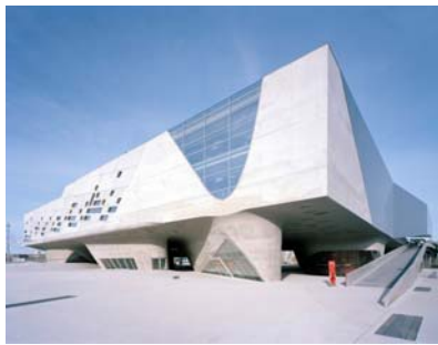
Σχ.1. Wolfsburg Science Center Zaha Hadid

1. Εισαγωγή. Ιστορική επισκόπηση αρχιτεκτονικού σκυροδέματος στη Προκατασκευή. Πρωτοποριακοί Αρχιτέκτονες και η Προκατασκευή. Παρουσίαση Διεθνών και Ελληνικών κτιρίων με χρήση προκατασκευασμένων στοιχείων αρχιτεκτονικού σκυροδέματος.