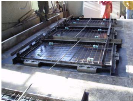
Σχ.3. Παραγωγή «Επί μέτρω»

2. Οι αρχιτεκτονικές απαιτήσεις και η ανταπόκριση από την Βιομηχανία της Προκατασκευής: Η εξασφάλιση των προαπαιτούμενων τεχνικών δεσμεύσεων και παραμέτρων. Παρουσίαση νέας τεχνολογίας βιομηχανικής παραγωγής μη τυποποιημένων στοιχείων. (Παραγωγή «Επί μέτρω»), καθώς της αλλαγής μεθόδων παραγωγής και τους παραμέτρους επιρροής διαμόρφωσης Αρχιτεκτονικού σκυροδέματος: Δόνηση, αποκαλούπωση, συντήρηση, αποθήκευση, μεταφορά και συναρμολόγηση, των προκατασκευασμένων στοιχείων με αρχιτεκτονικό σκυρόδεμα (Π.Σ.Α.Σ.). Τρόποι σύνδεσης και στερέωσης Π.Σ.Α.Σ. Έτοιμα Εξαρτήματα στερέωσης πετασμάτων κλπ μη φερόντων στοιχείων. Κανονισμοί και έλεγχοι.