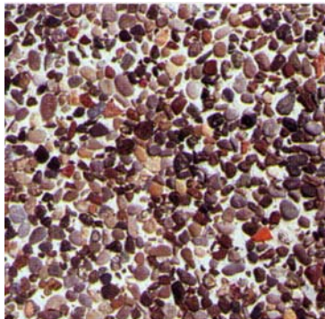
Σχ.7. Απογυμνωμένο σκυρόδεμα με έγχρωμα αδρανή

4. Έγχρωμες επιφάνειες προκατασκευασμένων στοιχείων σκυροδέματος με χρήση εγχρώμων αδρανών. Προϋποθέσεις, βιομηχανοποιημένης τεχνολογίας παραγωγής: Τεχνολογία παρασκευής σκυροδέματος (Κοκκομετρία, δοσομετρία κλπ), συντήρηση, αποθήκευση, μεταφορά κλπ. Εφαρμογές.