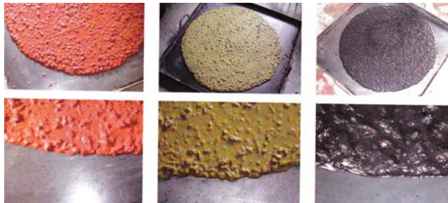
Σχ.10. Δοκίμες κάθισης έγχρωμου ΑΣΣ σκυροδέματος.