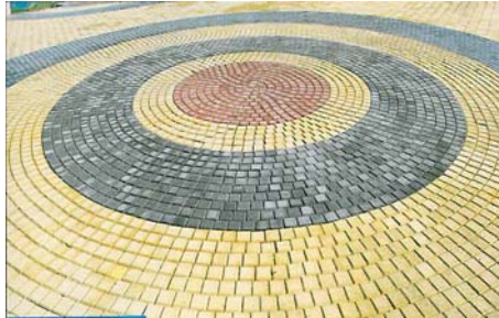
Σχ.11. Αστοχίες: Εξανθήματα ασβέστου

Αναφορά κανονισμών, τεχνικών εγκυκλίων κλπ. Συμβατικές υποχρεώσεις και δεσμεύσεις. Απαιτούμενοι έλεγχοι και συνήθειες αστοχίες. Παραδείγματα