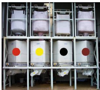
Σχ. 9. Δοσομετρική συσκευή

5. Έγχρωμα προκατασκευασμένα στοιχεία σκυροδέματος με χρήση Ορυκτών χρωμάτων. Προϋποθέσεις, βιομηχανοποιημένης τεχνολογίας παραγωγής: Ποιοτική αξιολόγηση τσιμεντοχρωμάτων, τεχνολογία παρασκευής Σκυροδέματος, (Κοκκομετρία, δοσομετρία κλπ) συντήρηση, αποθήκευση, μεταφορά κλπ. Εφαρμογές