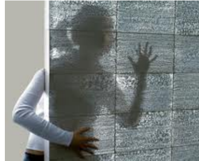
Σχ. 12. Διαφανές σκυρόδεμα

7. Εφαρμογές προκατασκευασμένων στοιχείων με χρήση καινοτόμων σκυροδεμάτων & οπλισμών: Αναφορά εφαρμογών προκατασκευασμένων στοιχείων με καινοτόμα σκυροδέματα: όπως Πολυεστερικό σκυρόδεμα, Αυτοσυμπυκνούμενο Σκυρόδεμα (ΑΣΣ), με μεταλλικά, και με μη μεταλλικά πλέγματα (Ferrocement & TRC), Διαφανές σκυρόδεμα. Προκατασκευασμένα προϊόντα με ψυχρά υλικά. Αυτοκαθαριζόμενο σκυρόδεμα κλπ. Εφαρμογές και παραδείγματα.