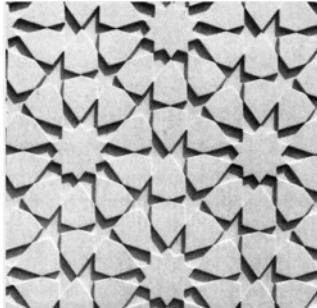
Σχ.5. Ανάγλυφη επιφάνεια πετάσματος.

3. Εμφανή προκατασκευασμένα στοιχεία σκυροδέματος διαμορφωμένης Επιφάνειας: Μέθοδοι διαμόρφωσης. Παρουσίαση της τεχνολογίας βιομηχανικής διαμόρφωσης ανάγλυφης, απογυμνωμένης, στιλβωμένης κ.α. μορφών επιφάνειας των Π.Σ.Α.Σ