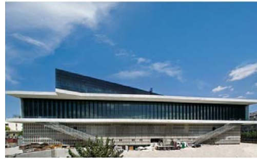
Σχ. 2. Νέο Μουσείο Ακρόπολης Αθηνών B. Tschoumi, M. Φωτιάδης

2. Οι αρχιτεκτονικές απαιτήσεις και η ανταπόκριση από την Βιομηχανία της Προκατασκευής: Η εξασφάλιση των προαπαιτούμενων τεχνικών δεσμεύσεων και παραμέτρων. Παρουσίαση νέας τεχνολογίας βιομηχανικής παραγωγής μη τυποποιημένων στοιχείων. (Παραγωγή «Επί μέτρω»), καθώς της αλλαγής μεθόδων παραγωγής και τους παραμέτρους επιρροής διαμόρφωσης Αρχιτεκτονικού σκυροδέματος: Δόνηση, αποκαλούπωση, συντήρηση, αποθήκευση, μεταφορά και συναρμολόγηση, των προκατασκευασμένων στοιχείων με αρχιτεκτονικό σκυρόδεμα (Π.Σ.Α.Σ.). Τρόποι σύνδεσης και στερέωσης Π.Σ.Α.Σ. Έτοιμα Εξαρτήματα στερέωσης πετασμάτων κλπ μη φερόντων στοιχείων. Κανονισμοί και έλεγχοι.