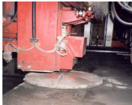
Σχ.8.Επιφανειακή επεξεργασία στιλβωσης

5. Έγχρωμα προκατασκευασμένα στοιχεία σκυροδέματος με χρήση Ορυκτών χρωμάτων. Προϋποθέσεις, βιομηχανοποιημένης τεχνολογίας παραγωγής: Ποιοτική αξιολόγηση τσιμεντοχρωμάτων, τεχνολογία παρασκευής Σκυροδέματος, (Κοκκομετρία, δοσομετρία κλπ) συντήρηση, αποθήκευση, μεταφορά κλπ. Εφαρμογές