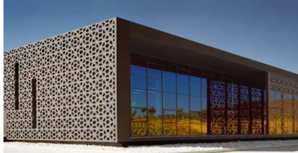
Σχ.6. Κτίριο γραφείων στην Παιανία, Αττικής.

4. Έγχρωμες επιφάνειες προκατασκευασμένων στοιχείων σκυροδέματος με χρήση εγχρώμων αδρανών. Προϋποθέσεις, βιομηχανοποιημένης τεχνολογίας παραγωγής: Τεχνολογία παρασκευής σκυροδέματος (Κοκκομετρία, δοσομετρία κλπ), συντήρηση, αποθήκευση, μεταφορά κλπ. Εφαρμογές.